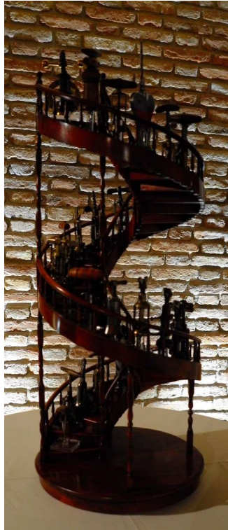
A sinistra: La scala elicoidale con 30 gradini e altrettanti cavatappi allestita per celebrare il XXX° della AICC.