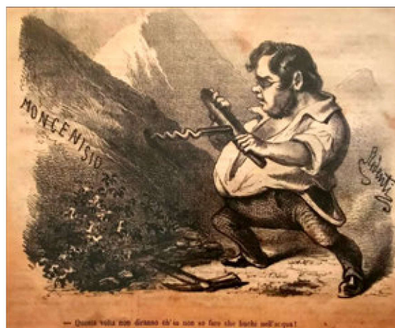
Immagine di Francesco Ridenti tratta dal giornale satirico-politico “Il Fischietto”. Ritrae Cavour intento a trivellare il Moncenisio con un enorme cavatappi. Fu infatti Cavour nel giugno 1857 che deliberò di costruire il tunnel del Frejus (o del Moncenisio) inaugurato nel 1871.