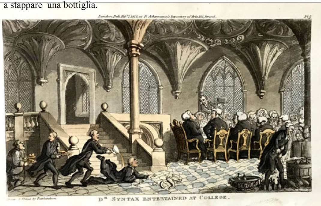
Scena di pranzo collegiale con inserviente intento a stappare una bottiglia.