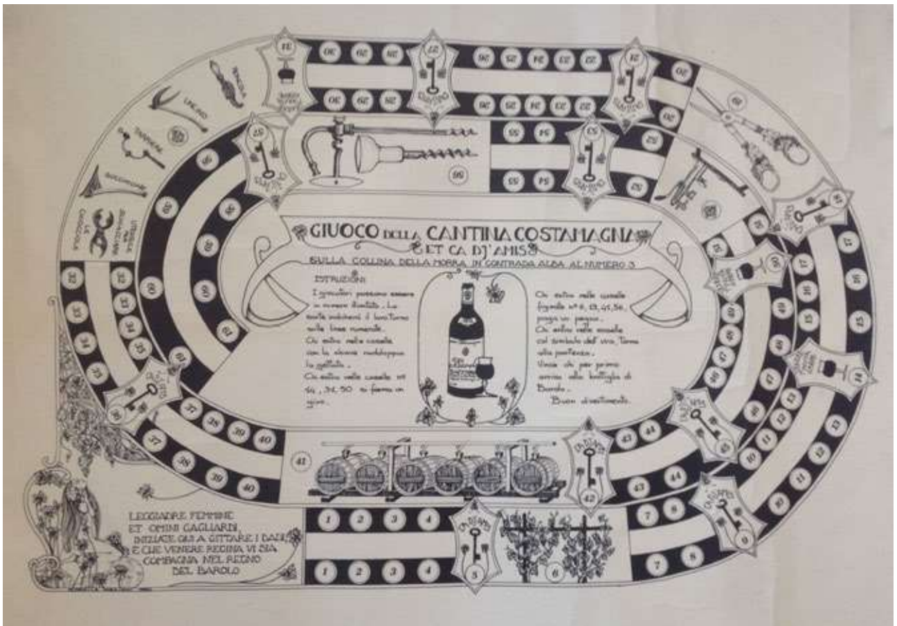
Gioco dell’oca fatto realizzare dalle Cantine Costamagna di “La Morra”, dove compaiono cava-tappi e attrezzi inerenti la cantina.