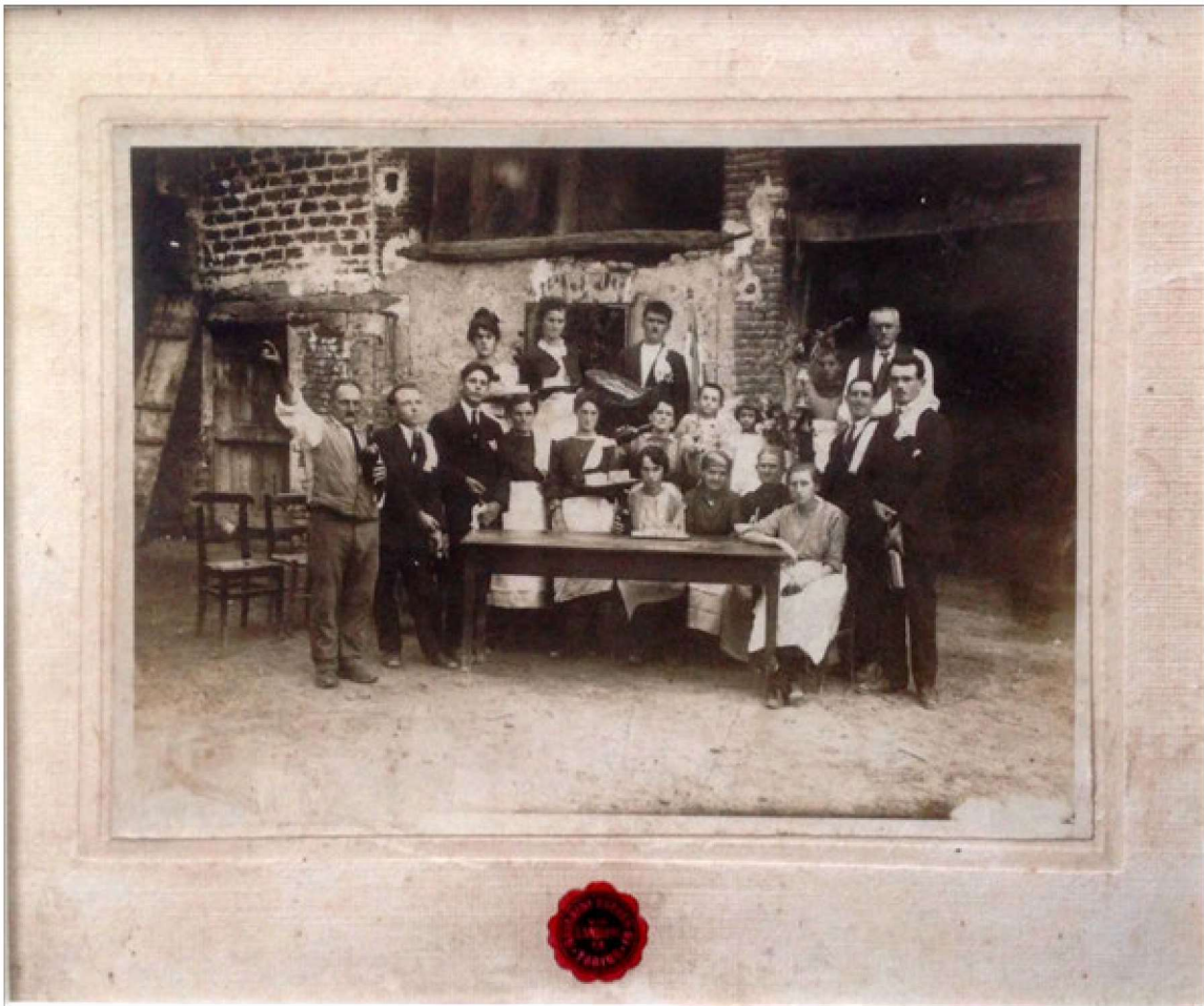
Foto di una festa contadina sull'aia di una cascina piemontese. Nell'immagine si notano ben tre inservienti che contemporaneamente stappano una bottiglia.