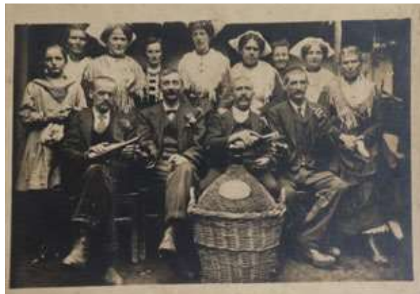
Tre diverse tipologie di commensali: l'intento comune è festeggiare con un brindisi.