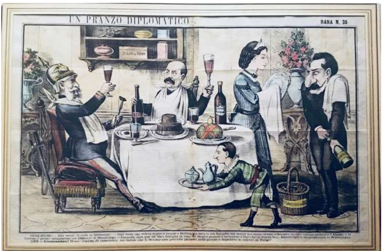
Stampa ironico-grottesca che propone l’incontro storico tra Guglielmo I° Bismark e Luigi XIV (Gigi). L’Alsazia-Lorena, regione di frontiera, è stata soggetta a diverse occupazioni e cambiamenti di sovranità. (Ben quattro dal 1870 al 1945).