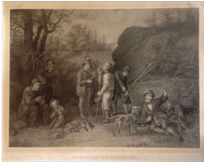
Stampa con scena (dopo la caccia). Riposo dei cacciatori con personaggio intento a stappare una bottiglia.