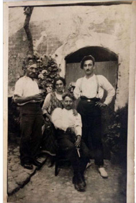
Sopra: foto di amici con stappo e brindisi

Sotto: foto di gruppo che festeggia l'arrivo o la partenza di uno di loro. Nella scena è visibile la bottiglia con cavatappi a concertina. Provenienza zona Canavese (Piemonte).