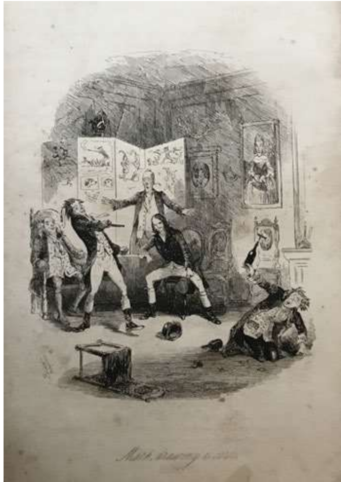
Piccola stampa con scena di duello dove un personaggio si difende brandendo una bottiglia e un cavatappi.