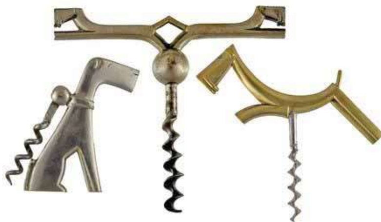
Tre cavatappi in ottone di produzione della WHW. Collezione Corkscrew Inn.