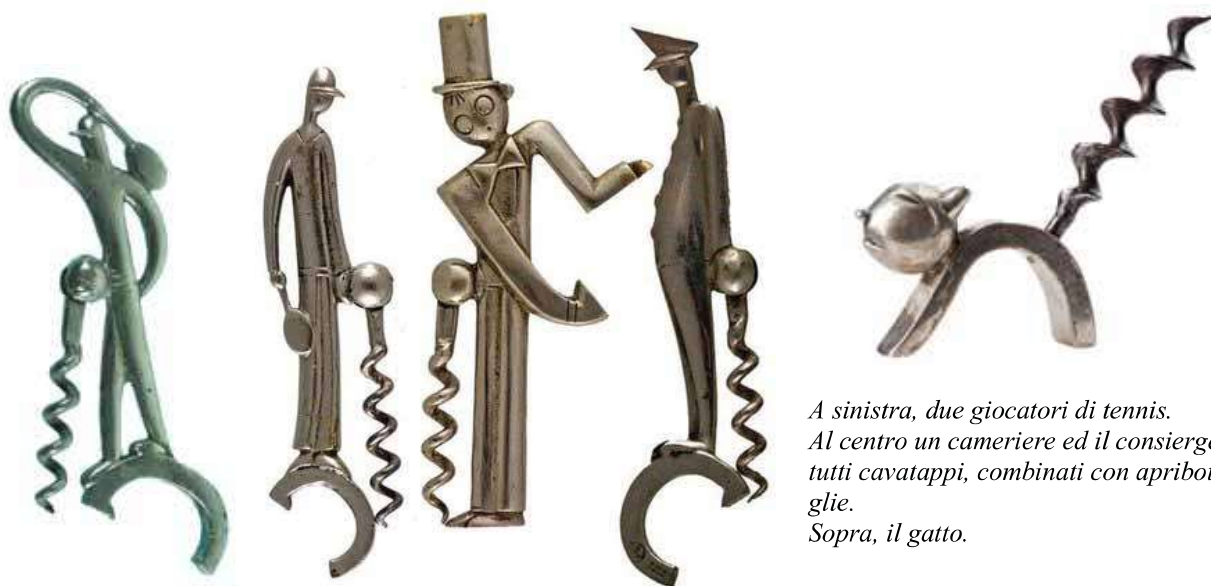
A sinistra, due giocatori di tennis. Al centro un cameriere ed il consierge, tutti cavatappi, combinati con apribottiglie. Sopra, il gatto.