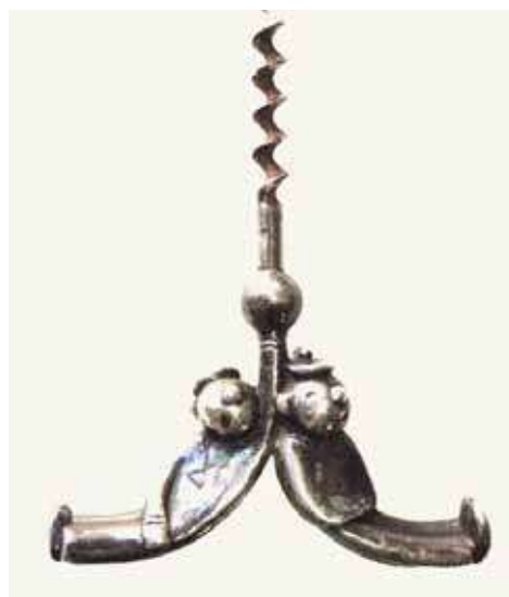
A sinistra, due esemplari di cavatappi con apribottiglie che rappresentano giocatori di golf. Sopra, due marinai ubriachi.